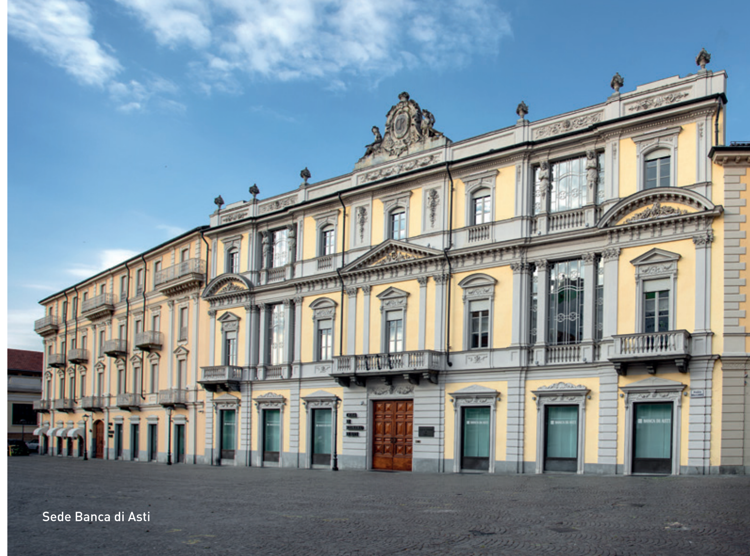
Sede Banca di Asti

Confluenza organica dei temi ESG nella pianificazione strategica. La banca si prepara alla rendicontazione secondo la nuova CSRD (Corporate Sustainability Reporting Directive) dell'Unione Europea.